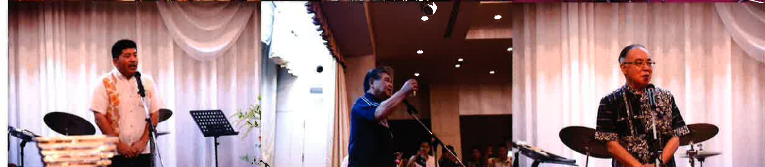
當眞淳北部市町村会長